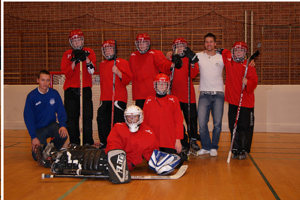
Det nye hold fra Jernløse GF fik en god oplevelse