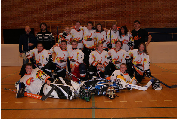
Glade vindere fra Køge Fireballs

udstyr til Jernløse. Vedlagt et par billeder. Med venlig hilsen, Laurent Fournier, RUSKK - Rulleskøjteklubben Køge”